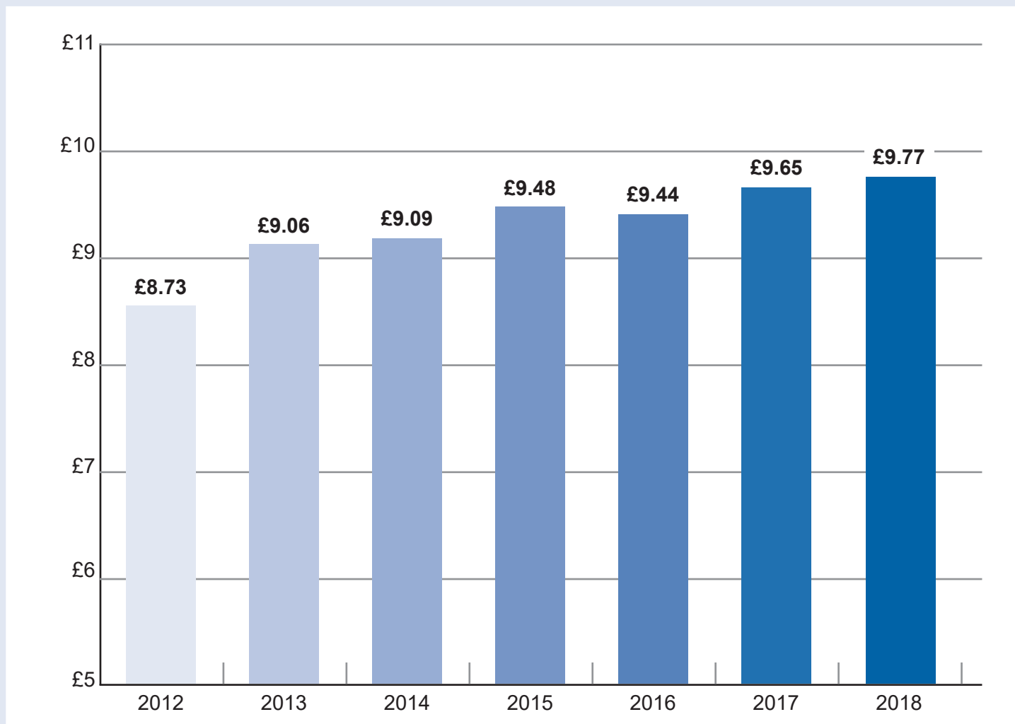
Ffigur Gwybodaeth 4: Gwariant Plwyfi 2018.